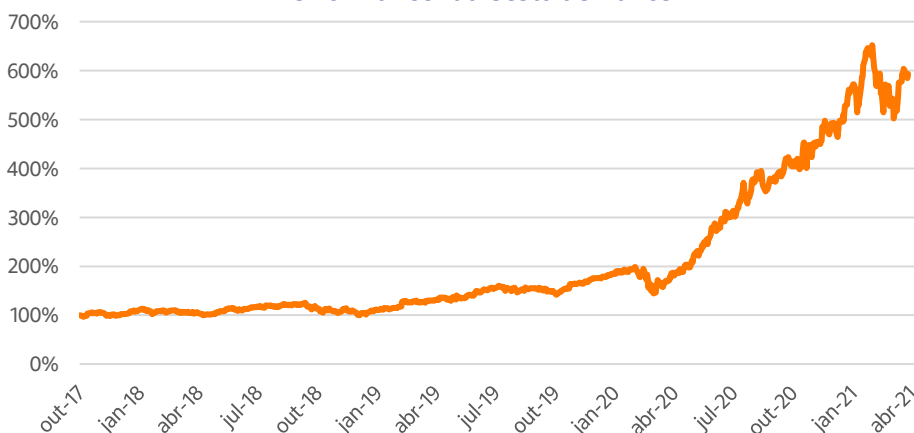
Performance* da Cesta de Ativos

A menção a rentabilidades passadas não é garantia de rentabilidade futura