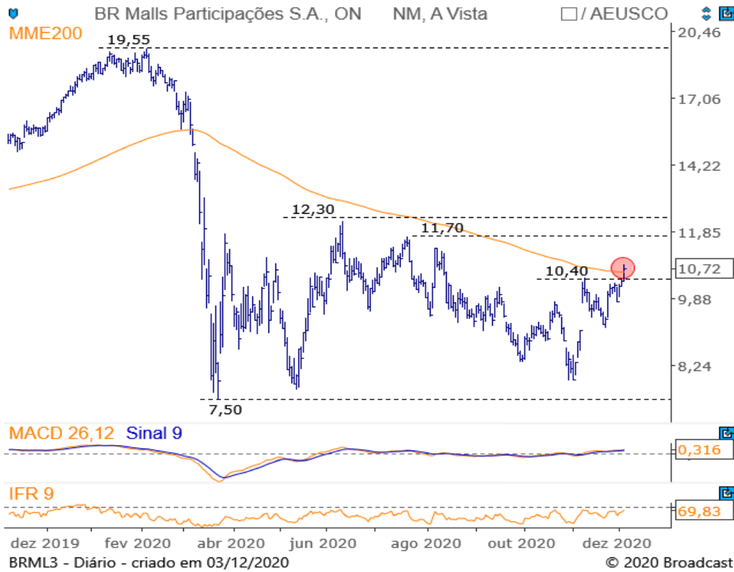
Gráfico Diário – BRML3